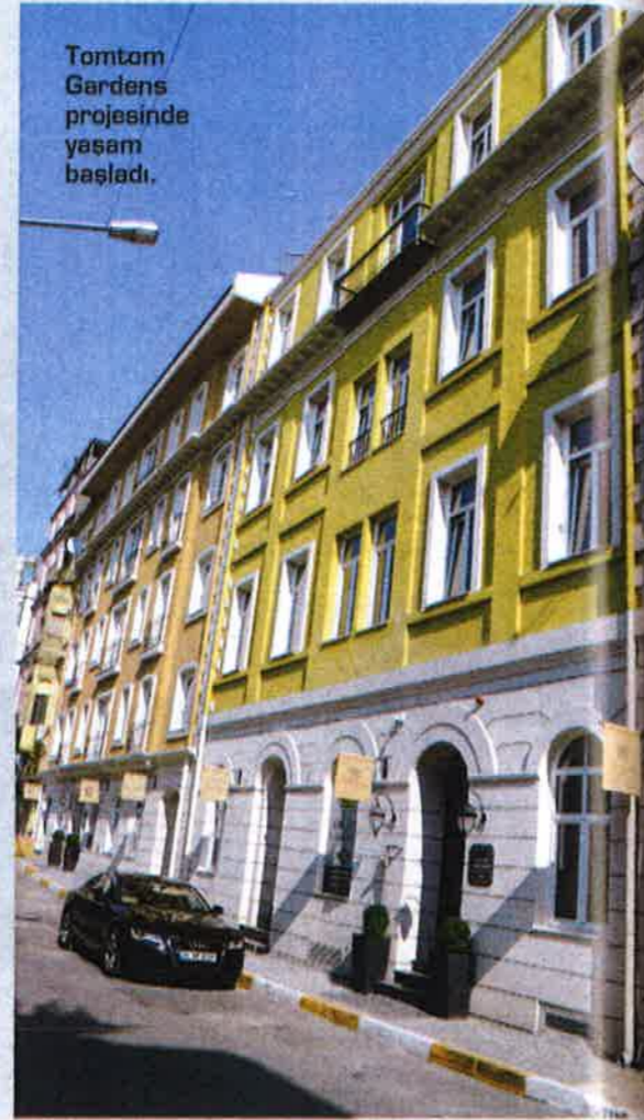
Tomtom Gardens projesinde yaşam başladı.

17 binadan oluşan Tomtom Gardens'da, bölgenin tarihi dokusunu koruyacak biçimde yeniden hayata geçirilmesini ve yaratacağı sosyal alanlarla bulunduğu mahalle ve bölge yaşamının değişimine katkıda bulunması hedeflenmiş.